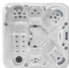
HC DESIGN 1 HC 1