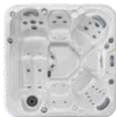
CELTIC 1 CSHC 1